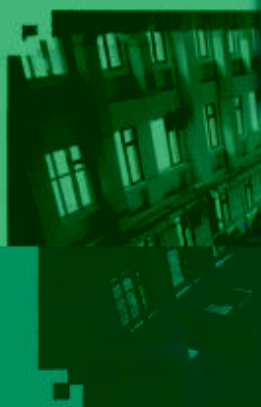
CNC 数控技术 训练场所